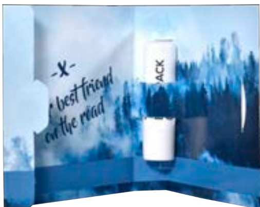
Sample kaart lippenbalsem 7001

omschrijving meerprijs sample kaart voor lippenbalsem, incl. handling