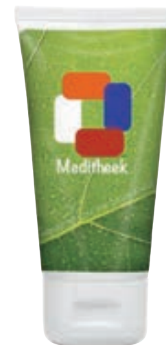
Handcrème 50 ml