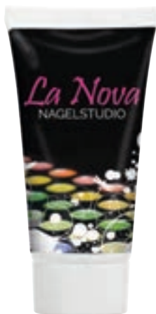
Handcrème 25 ml