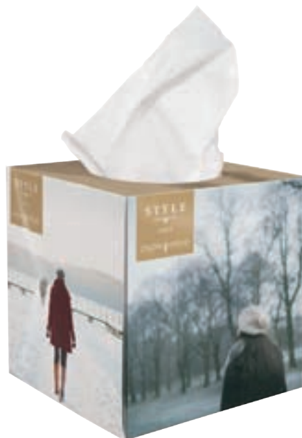
Tissue box large