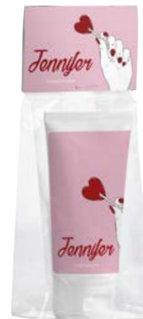
Blokbodenzakje met kopkaart 4113

omschrijving meerprijs blokbodenzakje met kopkaart formaat zakje 6,5 x 4,5 x 12 cm formaat kaart 7 x 5 cm bedrukking 2-zijdig