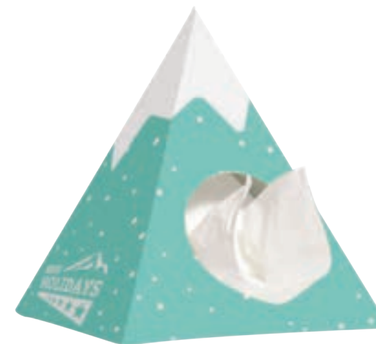
Pyramide tissue box 9540

omschrijving pyramide tissue box gevuld met 50 2-laags tissues formaat 14,5 x 14,5 x 18,5 cm bedrukking all-over levertijd ca. 4 weken na goedkeuring proef