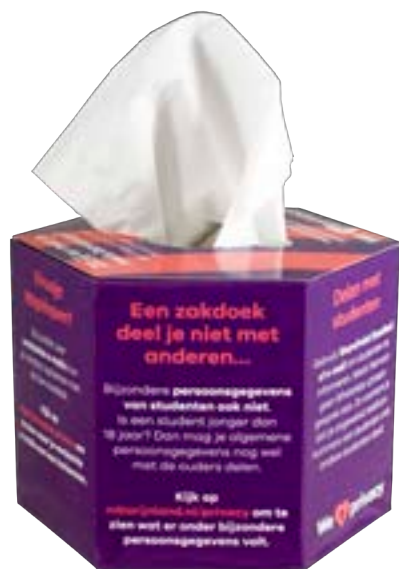
Tissue box hexagon 9528

omschrijving hexagon tissue box gevuld met 100 2-laags tissues formaat 14 x 14 x 10 cm bedrukking all-over levertijd ca. 4 weken na goedkeuring proef