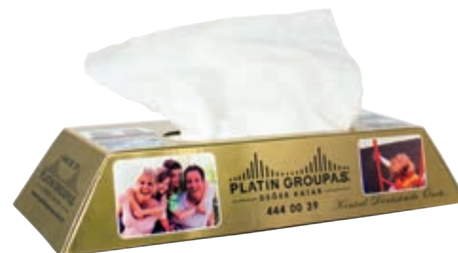
Tissue box goudstaaf 9529

omschrijving goudstaaf tissue box gevuld met 50 2-laags tissues formaat 21,5 x 8,5 x 4 cm bedrukking all-over levertijd ca. 4 weken na goedkeuring proef