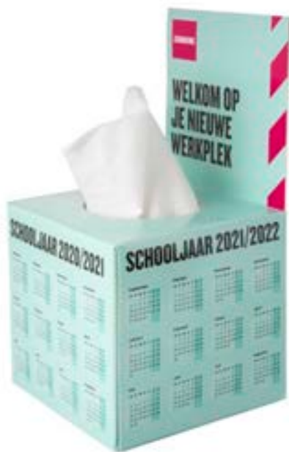
Tissue box met flap