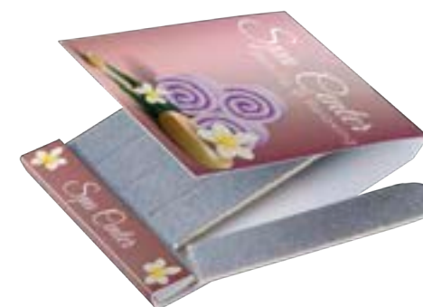
Matchbook nagelvijltjes 9030

omschrijving matchbook met 5 afbreekbare nagelvijltjes