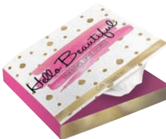
Book style tissue box 9530

omschrijving book style tissue box met flap gevuld met 30 2-laags tissues formaat 15,5 x 15,5 x 2 cm bedrukking all-over levertijd ca. 4 weken na goedkeuring proef