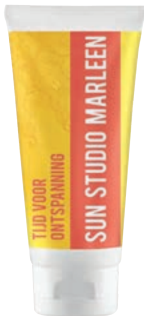
Zonnebrandcrème 100 ml