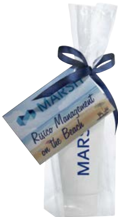
Blokbodenzakje met kaart 4110

omschrijving meerprijs blokbodenzakje met kaart en lint formaat zakje 6,5 x 4,5 x 20 cm formaat kaart 5,5 x 8,5 cm bedrukking 1-zijdig