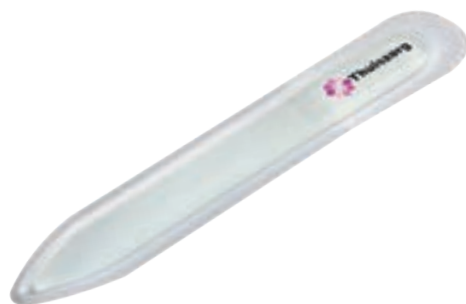
Glasnagelvijl mini 9010

omschrijving hoogwaardige mini glasnagelvijl verpakt in een witte pouch