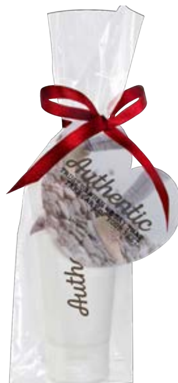
Blokbodenzakje met kaart eigen vorm 4112

omschrijving meerprijs blokbodenzakje met kaart in eigen vorm en lint formaat zakje 6,5 x 4,5 x 20 cm formaat kaart maximaal 8 x 8 cm bedrukking 1-zijdig