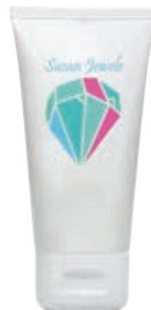
Handcrème 50 ml