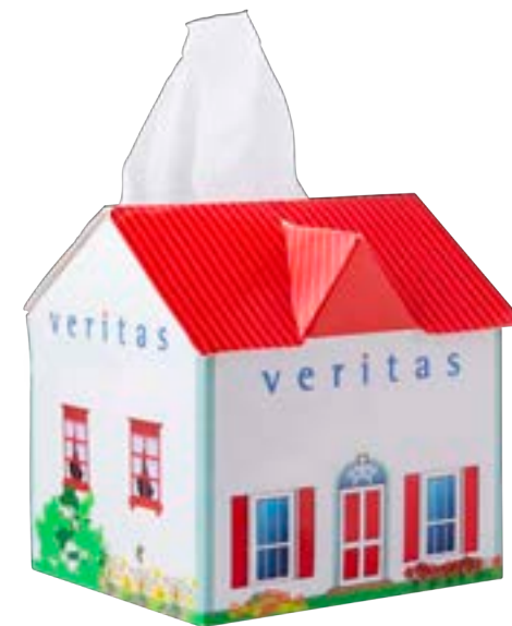
Tissue box huis