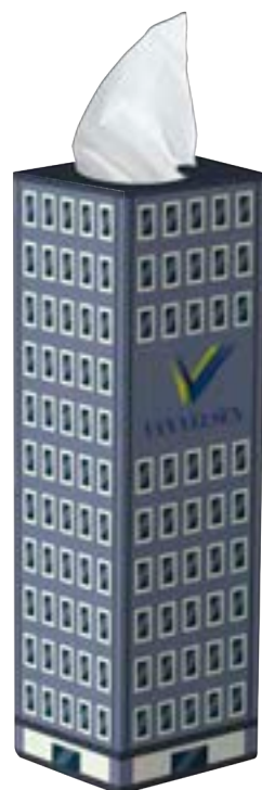
Tissue box toren 9526

omschrijving toren tissue box gevuld met 50 2-laags tissues formaat 6 x 6 x 20,5 cm bedrukking all-over levertijd ca. 4 weken na goedkeuring proef