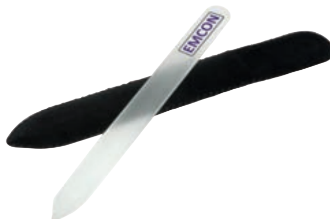
Glasnagelvijl luxe 9020

omschrijving hoogwaardige glasnagelvijl verpakt in een zwart fluwelen pouch