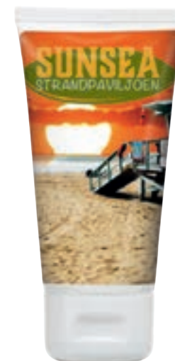
Aftersun 50 ml