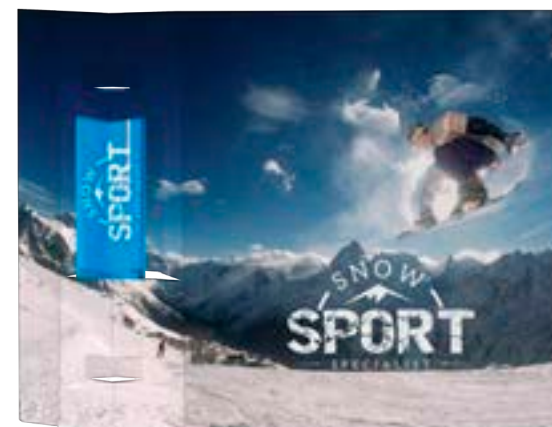
Display kaart lippenbalsem 7003

omschrijving meerprijs displaykaart met lippenbalsem, incl. handling