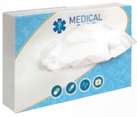
Rechthoekige tissue box 9520

omschrijving rechthoekige tissue box gevuld met 50 2-laags tissues formaat 17,5 x 11,5 x 3,5 cm bedrukking all-over levertijd ca. 4 weken na goedkeuring proef