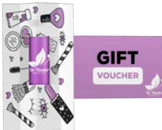
Visitekaart lippenbalsem 7002

omschrijving meerprijs visitekaart voor lippenbalsem, incl. handling